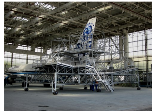
Combi Tail Dock Boeing B737