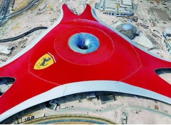
Ferrari World Abu Dhabi