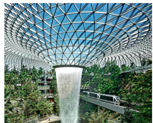
Jewel Changi Airport Singapur